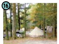
16 南木曽山麓 蘭キャンプ場 (南木曽町蘭)