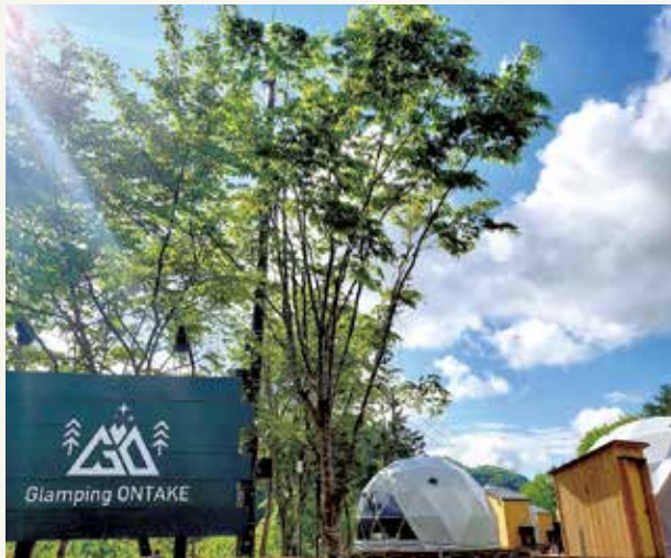
冷暖房完備、全7棟のドームテントをご用意