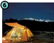
6 おんたけロープウェイ キャンプエリア (木曽町三岳)