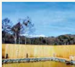
源泉かけ流しの混浴露天風呂