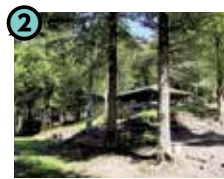
2 木曽駒 オートキャンプ場 (木曽町日義)