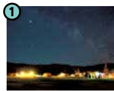
1 こだまの森 キャンプ場 (木祖村)