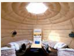
ポーランドから輸入したドーム型テントで快適にお過ごしいただけます