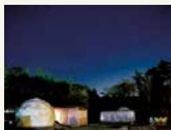
夜は手が届きそうなほど星空が近くに感じられます