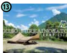
13 木曽ふれあいの郷 キャンプ場 (大桑村)