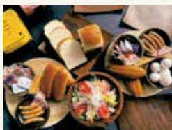
朝食は開田高原のパンに信州ハムを挟んでお楽しみください