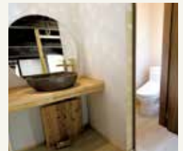
女性も安心の清潔なトイレ と手洗いスペース