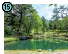
15 田立の滝 オートキャンプ場 (南木曽町田立)