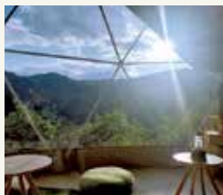
大きな窓から差し込む光で自然を体感