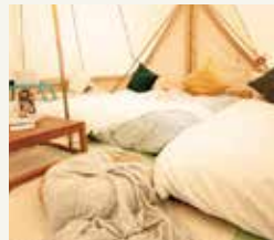
広々としたベルテント内には、 ベッドや最低限の住環境が 整い、安心して過ごせる