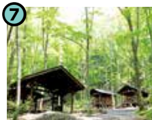
7 キャンピングフィールド 木曽古道 (木曽町福島)