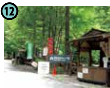
12 阿寺溪谷キャンプ場 (大桑村)