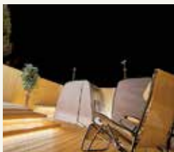
追加オプションでテントサウナもご利用できます