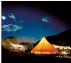
夜はライティングと星空が 雰囲気演出