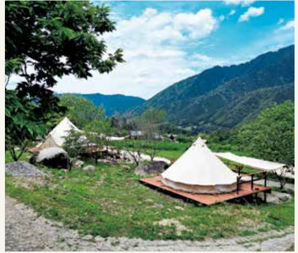
自然の中に溶け込み、静かな里山体験を満喫