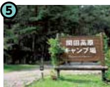
5 開田高原キャンプ場 (木曽町開田高原)