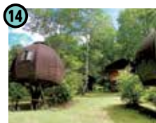
14 のぞきど森林公園 キャンプ場 (大桑村)