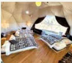
広々としたドームテント内