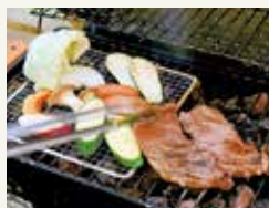
夕食は信州牛のBBQをお楽しみいただけます