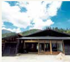
モダンに再生、利活用された 築150年の古民家管理棟は、 “中山道”の歴史を感じさせる