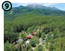
9 おんたけ休暇村 キャンプ場 (王滝村)