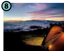
8 CAMP ONTAKE (王滝村)