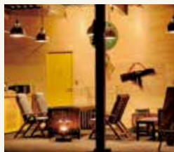
グランピングセンターハウス