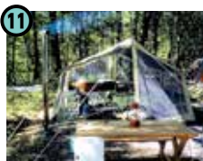
11 おんたけ森さち オートキャンプ場 (王滝村)