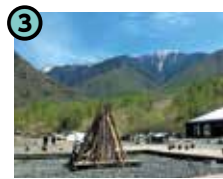
3 木曽駒冷水公園 (木曽町新開)