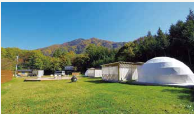
森に囲まれた空間で開放的な1日をお過ごしください

爽やかな木曾駒高原の森に包まれたグランピング施設です。澄み渡る山々の音で心を癒し、夜は満天の星空の中で、信州牛 BBQ や隣接するホテル棟の薬湯風呂をお楽しみいただけます。爽やかな風に包まれた心地よい時間と共に、木曾駒高原の自然体験をお楽しみください。