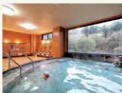
木曾エリアで古くから伝わる薬湯で温まりください