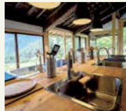
こだわりの炊事スペースは、 広い流し台に、給湯も完備