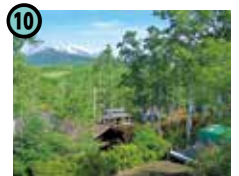
10 おんたけ銀河村 キャンプ場 (王滝村)