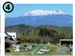
4 KISOFUKU HARAPPA (木曽町新開)