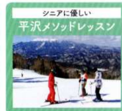
シニアに優しい 平沢メソッドレッスン

特別レッスン ポールレッスン、不整地レッスン、など様々なレッスンメニューが充実しております!