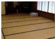
ふれあい交流センター 料金 6,000円~/1日

ファミリーAコース沿いにあるふれあい交流センター内和室(22畳) キッチンもついているので自炊もできます。 団体やグループでのご利用に最適です。 * 収容人員 20名