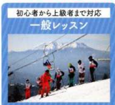
初心者から上級者まで対応 一般レッスン

スキーが初めてのお子様からシニアまであらゆるレベルに応じたレッスンメニューがあります。