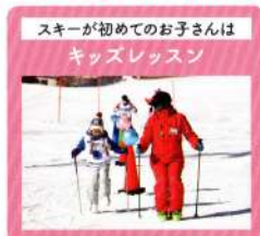
スキーが初めてのお子さんは キッズレッスン