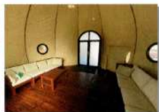
HAKUSANテント 料金 10,000円~/1日

レストランHAKUSANスカイデッキ先にあるドームテント。 エアコンを完備しており、HAKUSANからの料理の持ち込みも可能です。