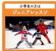
小学生の方は ジュニアレッスン